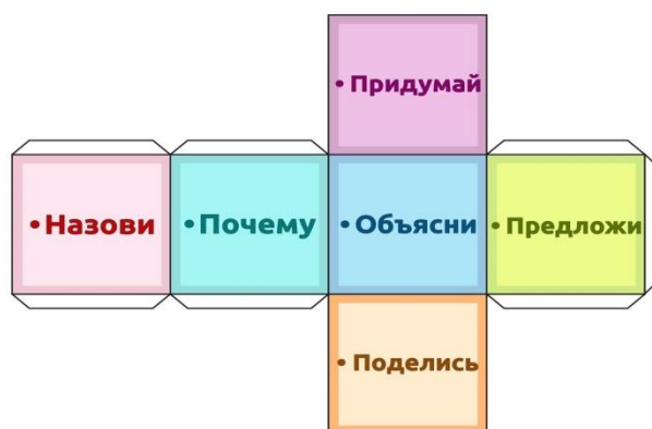
Рис. 1. Модель «Кубик Блума»

Задания «Предложи...», «Придумай...», «Поделись...» направлены на активизацию мыслительной деятельности ученика, который выделяет скрытые предположения, проводит различия между фактами и следствиями и анализирует, оценивает значимость данных, использует знания из разных областей, обращает внимание на соответствие вывода имеющимся данным.